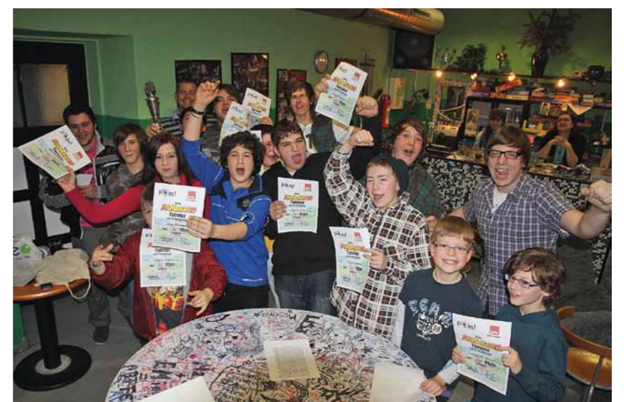
Angebote der Jusos im Jugendzentrum „Point“ – MarioKart Turnier 2012.