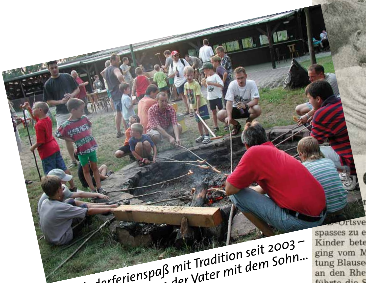
Kinderferienspaß mit Tradition seit 2003 – Wenn der Vater mit dem Sohn...