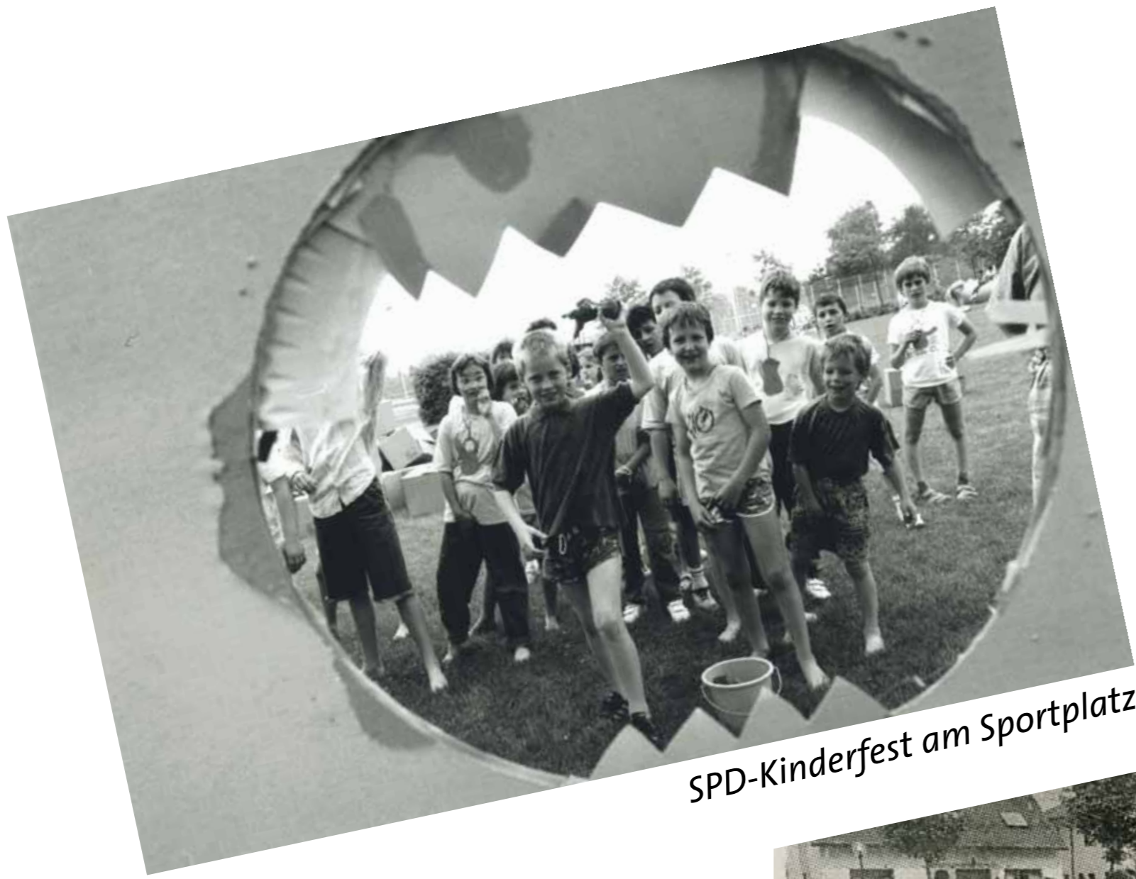
SPD-Kinderfest am Sportplatz.