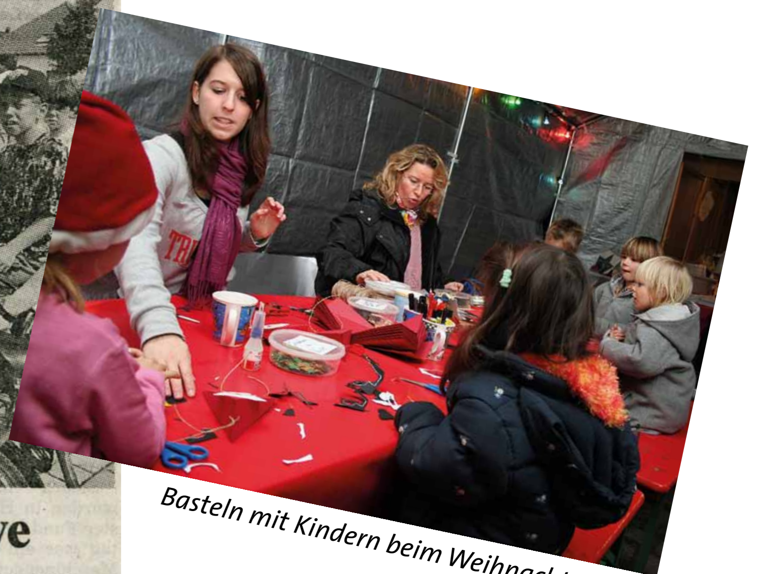
Basteln mit Kindern beim Weihnachtsmarkt.