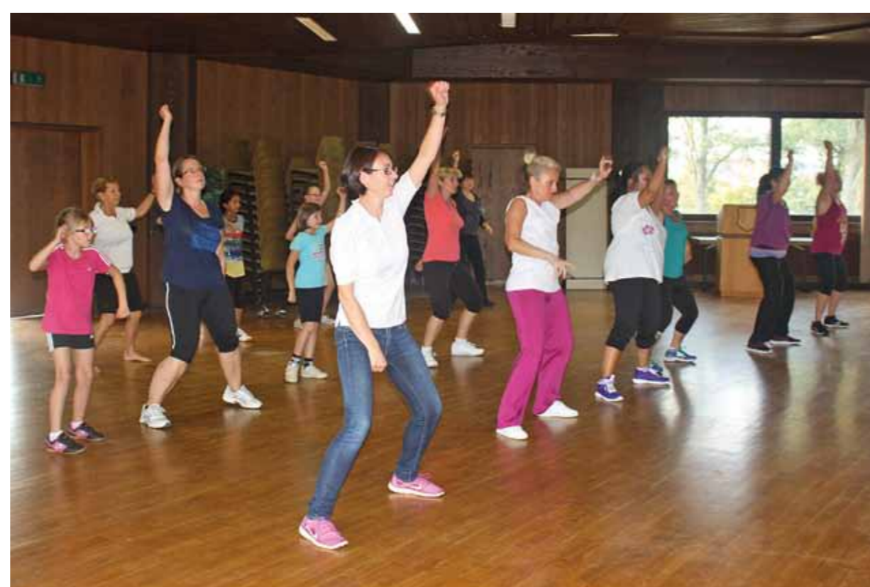
Kinderferienspaß heute – Wenn die Mutter und die Tochter Zumba tanzen.