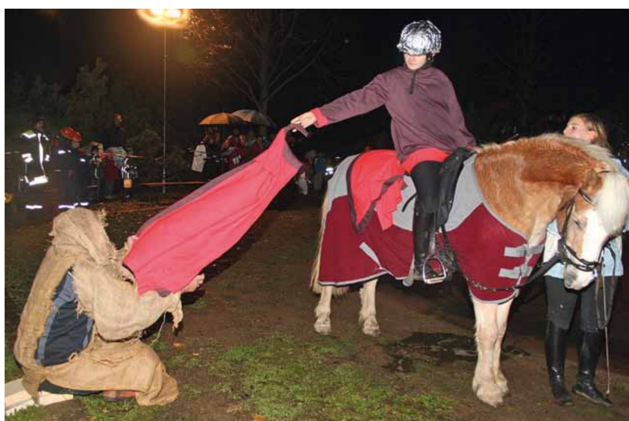
Organisation in Händen des Ortsvereins – jährlicher Umzug an St. Martin.