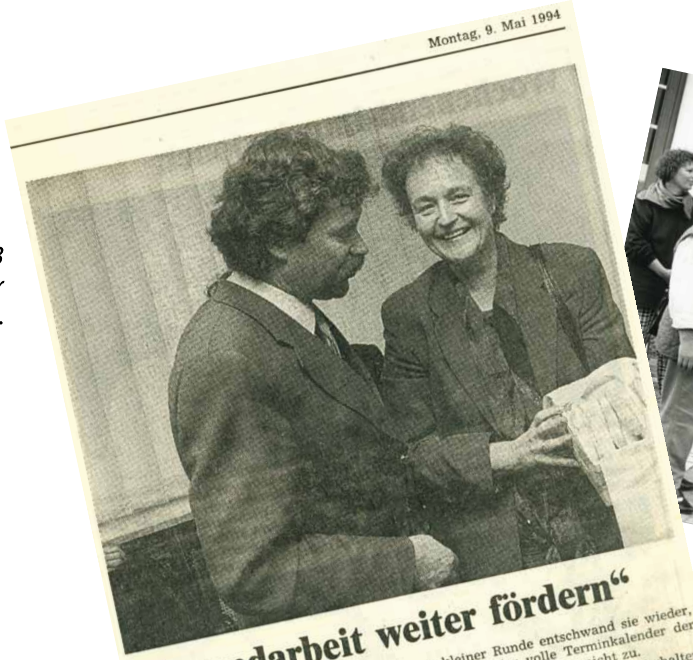
„Jugendarbeit weiter fördern“ Neulussheim. - „Wir müssen neue Modelle finden“, betonte Herta Däubler-Gmelin. Denn die Gesellschaft habe sich stark verändert. Zwischen Erdbeer- und kleiner Runde entschwand sie wieder, mehr ließ der volle Terminkalender der SPD-Spitzenpolitikerin nicht zu. „Die Möglichkeiten, soziales Verhalten in unserer Demokratie und geläuterten die Grundidee unserer Gesellschaft. Die Massenarbeiterschaft kränzt darüber hinaus ganz gewiss in den Häusern unserer sozialen Arbeitsgemeinschaften, den Betrieben, Krankenhäusern und Arbeitsstätten.“ Stippvisite im Rathaus – Gespräch über Kinder- und Jugendarbeit mit MdB Dr. Herta Däubler-Gmelin (Bundesministerin der Justiz von 1998 bis 2002).