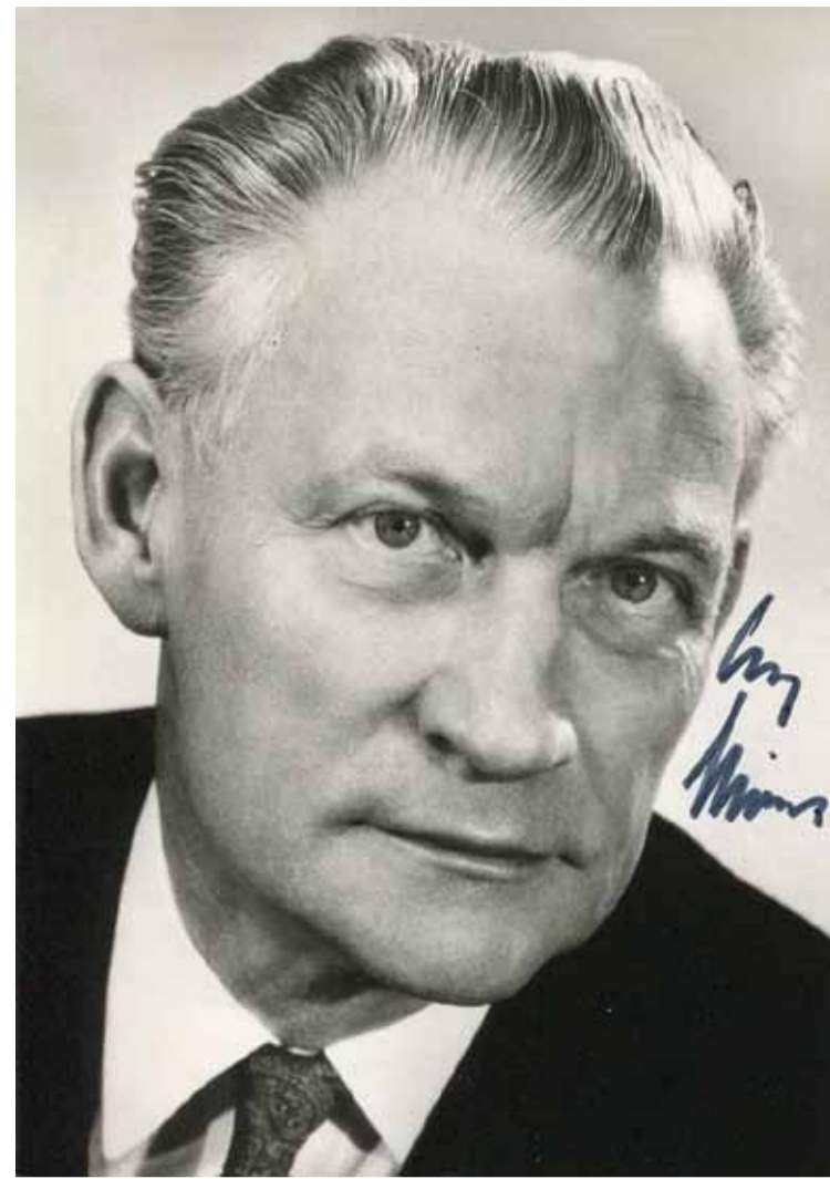
„Lußheimer Gespräche“ mit MdB Dr. Alex Möller (Bundesminister der Finanzen von 1969 bis 1971).