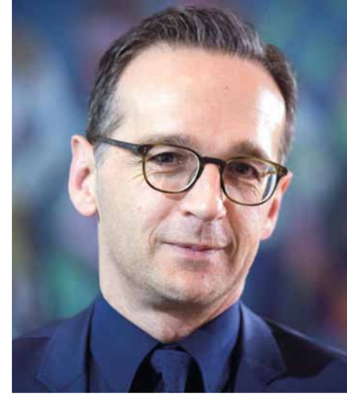
Kreisparteitag der SPD Rhein-Neckar 2005 mit Heiko Maas (Landesvorsitzender der SPD Saarland, seit 2013 Bundesminister der Justiz und für Verbraucherschutz).