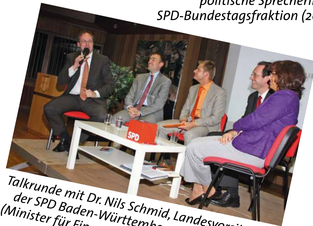
Talkrunde mit Dr. Nils Schmid, Landesvorsitzender der SPD Baden-Württemberg von 2009 bis 2016 (Minister für Finanzen und Wirtschaft sowie stellvertretender Ministerpräsident von Baden-Württemberg von 2011 bis 2016).

IM GESPRÄCH. POLITISCHE PROMINENZ IN NEULUSSHEIM.