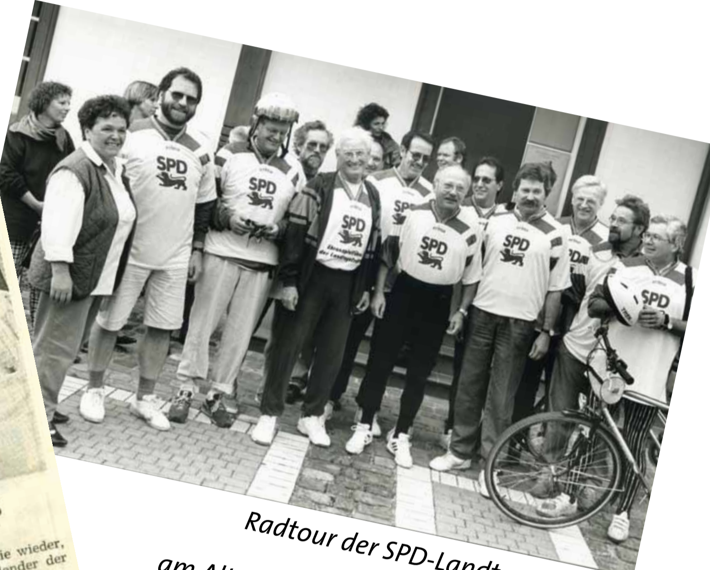
Radtour der SPD-Landtagsfraktion mit Zwischenstopp am Alten Bahnhof in Neulussheim (1994).