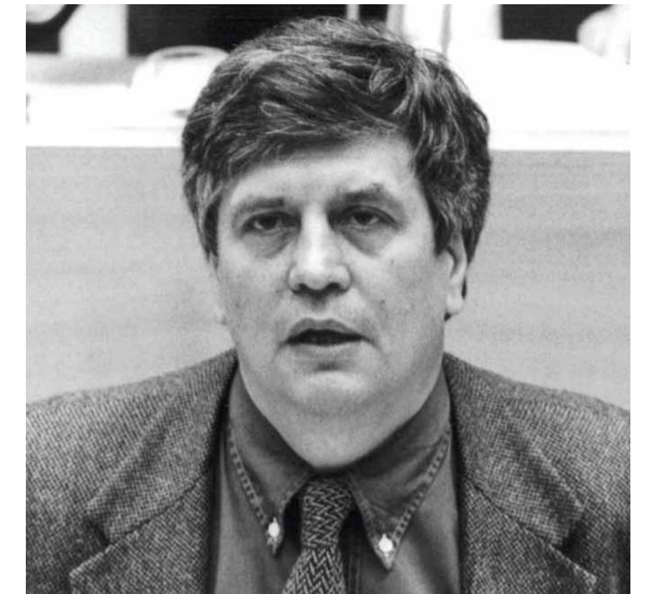
Politischer Brunch mit MdB Hermann Scheer (seit 1999 Träger des Alternativen Nobelpreises).