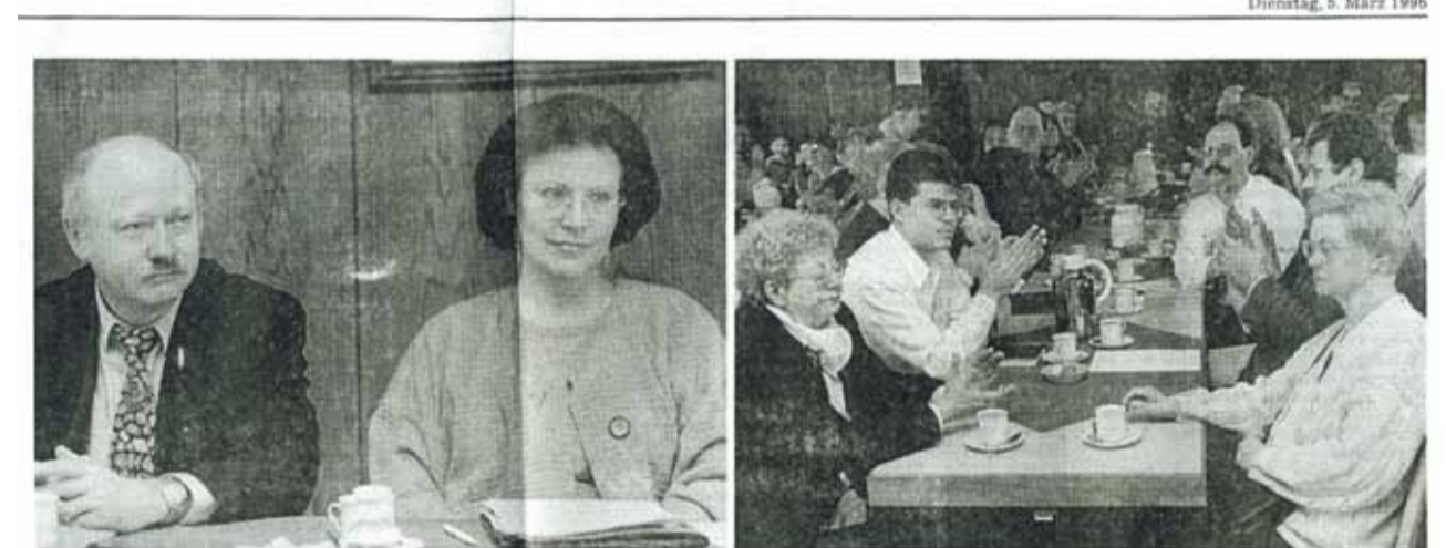
Sonntäglicher Polit-Brunch in Neulussheim „Nur SPD-Sieg gibt neuer Politik Chancen“ SPD-Bundespolitikerin Heidemarie Wiecek-Zeul und Gewerkschaftsvertreterin zu Gast Mit einer spenden-, offeneren und sozialistischen Veranstaltung hatten die SPD-Mitglieder in Neulussheim am Sonntag den 9. März 1986 ein Beispiel dafür an, dass die SPD eine Partei ist, die gegen die Ausweitung der Arbeiter, aber auch gegen die Ausweitung der Staber ist und für eine gleichberechtigte Partnerschaft steht. In einem kurzen Statement gab MdB Heidemarie Wiecek-Zeul, Bundesministerin für wirtschaftliche Zusammenarbeit und Entwicklung von 1998 bis 2009, an, dass die SPD eine Partei ist, die gegen die Ausweitung der Arbeiter, aber auch gegen die Ausweitung der Staber ist und für eine gleichberechtigte Partnerschaft steht. Politischer Brunch mit MdB Heidemarie Wiecek-Zeul, europapolitische Sprecherin der SPD-Bundestagsfraktion von 1987 bis 1998 (Bundesministerin für wirtschaftliche Zusammenarbeit und Entwicklung von 1998 bis 2009).