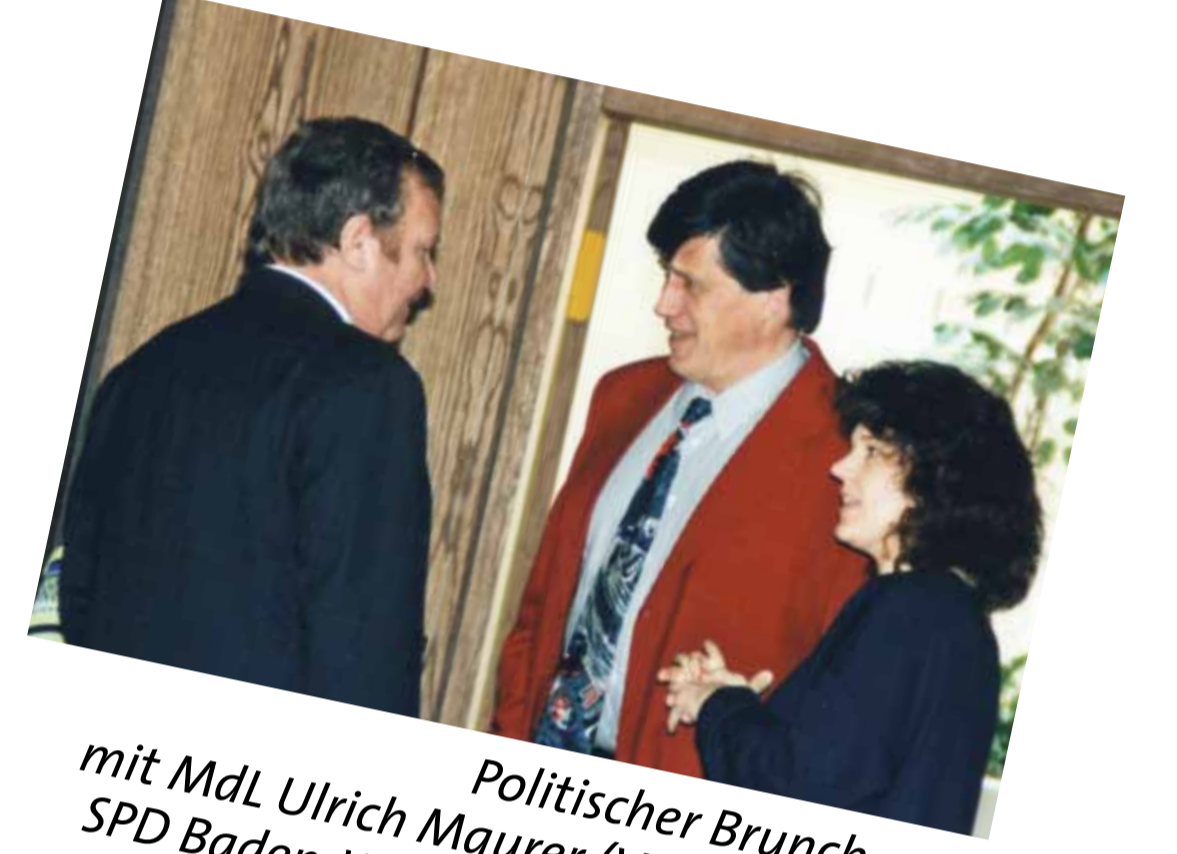
Politischer Brunch 1997 mit MdL Ulrich Maurer (Vorsitzender der SPD Baden-Württemberg und der Landtagsfraktion) und MdB Ute Vogt (Stv. SPD-Landesvorsitzende).